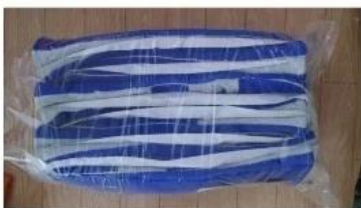
Pack into polybag