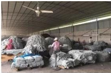
Tanning and dyeing