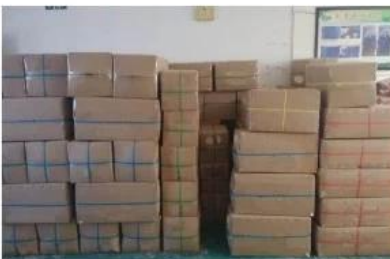
Pack into carton