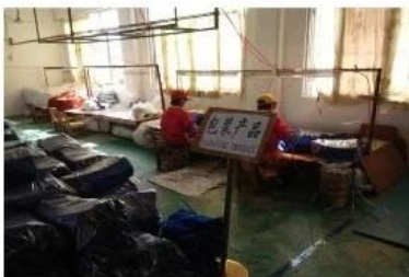
Checking and Packing